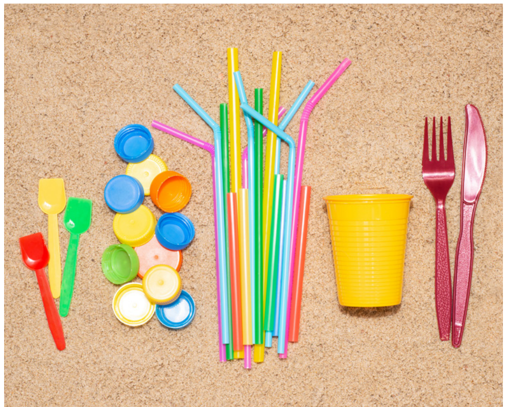
Mit der Einwegkunststoffrichtlinie von 2019 hat die EU-Kommission Verkaufsverbote für bestimmte Produkte aus Kunststoff auf den Weg gebracht. Besteck oder Trinkhalme aus Kunststoff dürfen nicht mehr vertrieben werden, Trinkbecher hingegen schon, solange sie nicht aus Polystyrol sind.

Im Zentrum der Diskussion um Abfälle steht das Material Kunststoff. Ein Material, das zwar äußerst vielseitig ist, aber unbehandelt schwere Umweltschäden verursachen kann. Es ist grundsätzlich gut recycelbar, dafür müssen aber häufig Voraussetzungen wie ein sinnvolles „Design for Recycling“ erfüllt sein. Welche Reaktionen eine überhitzte Debatte auslösen